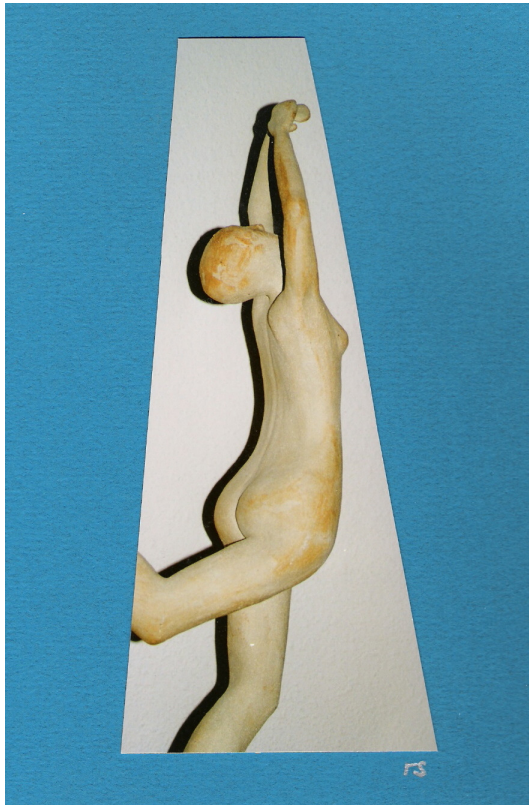
sich befreien tut gut